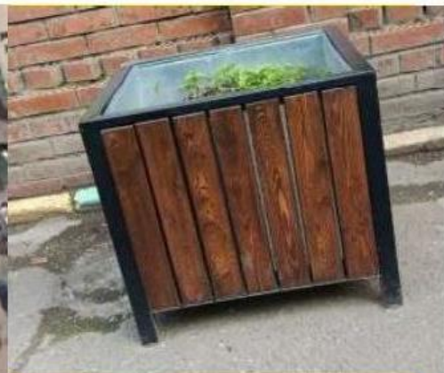
ВАЗОН ТАКОЙ ЖЕ, ТОЛЬКО ДЛИННЫЙ